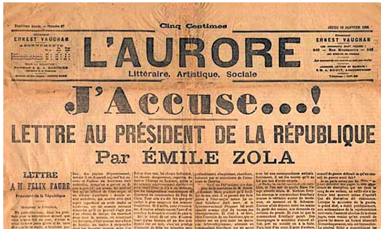
Musée d'Art et d'Histoire du Judaïsme

Η πρώτη σελίδα της εφημερίδας L'Aurore , φύλο της 13ης Ιανουαρίου 1898, με το παρεμβατικό Κατηγορώ του Εμίλ Ζολά, υπέρ του Ντρέυφους. Ο Ντρέυφους αθωώθηκε το 1906 –μετά το θάνατο του Ζολά– και αποκαταστάθηκε η στρατιωτική του τιμή. Ο Εμίλ Ζολά αγωνίστηκε για να επικρατήσει η αλήθεια έναντι του ψεύδους και η δικαιοσύνη έναντι της αδικίας. Αυτή η στάση είναι απόλυτα συμβατή με τις αρχές του δυτικού πολιτισμού. Οι πνευματικοί άνθρωποι στις ανοιχτές κοινωνίες συχνά παίρνουν το λόγο για να υπερασπιστούν αυτό που θεωρούν δίκαιο.