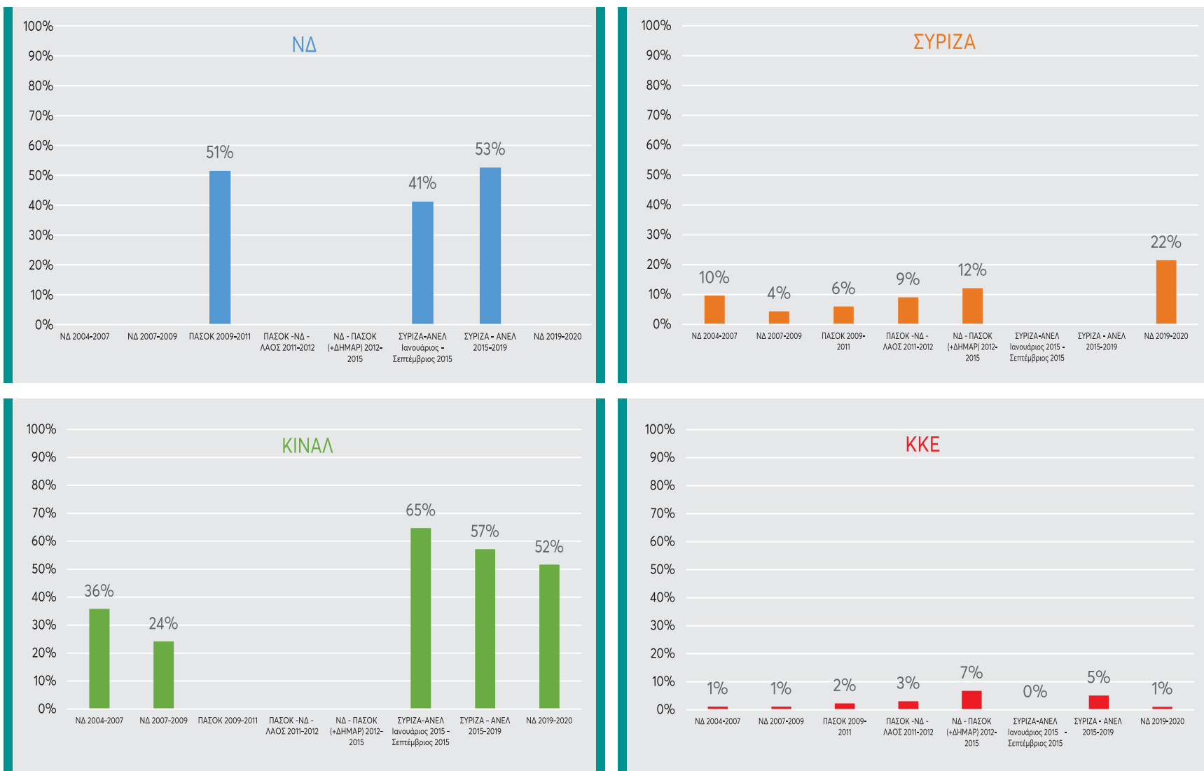
Γράφημα 2. Η εξέλιξη του Δείκτη Νομοθετικής Συναίνεσης ΝΔ, ΣΥΡΙΖΑ, ΚΙΝΑΛ, ΚΚΕ στην αντιπολίτευση από το 2004 έως το 2020