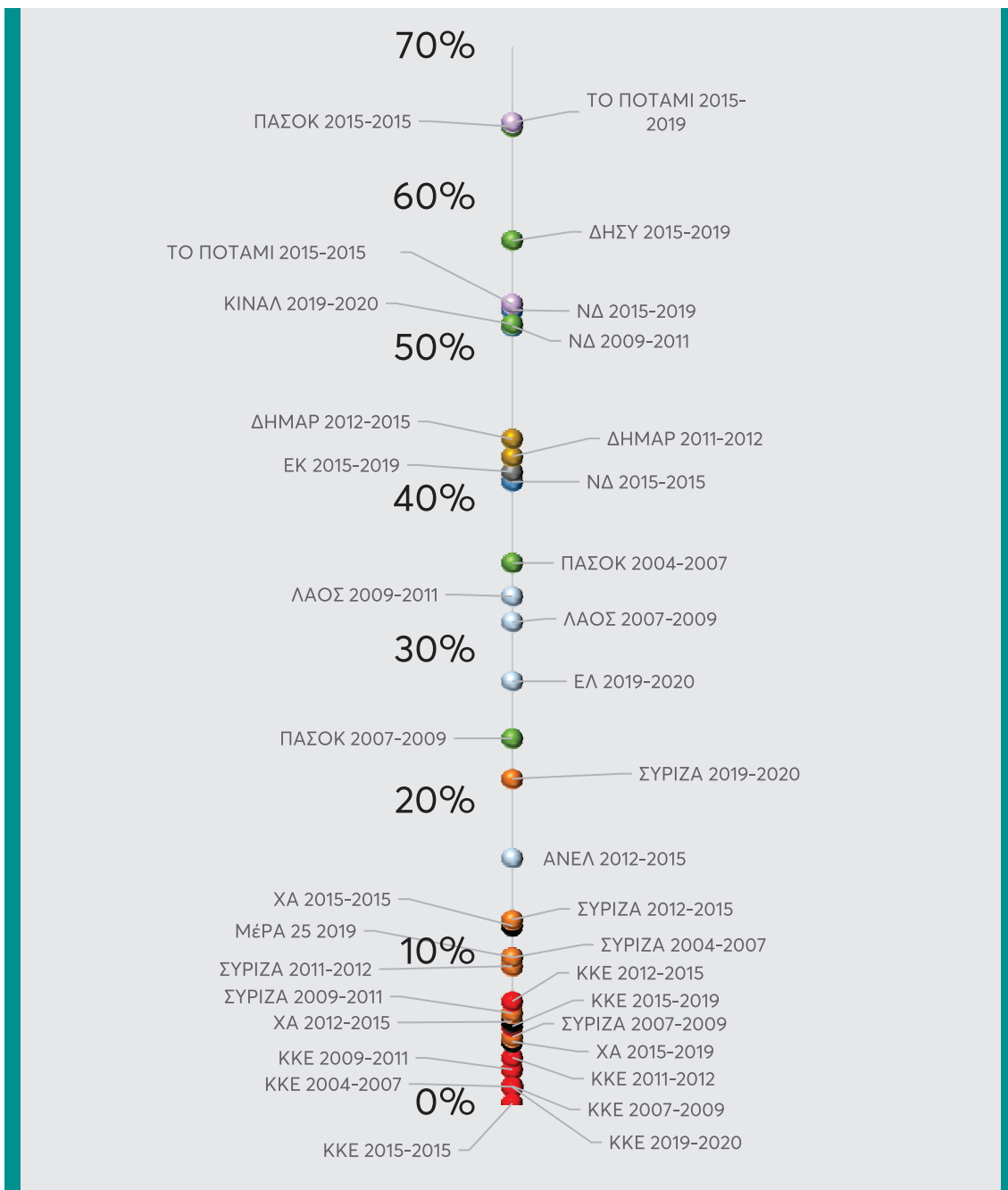
Γράφημα 3. Δείκτης Νομοθετικής Συναινεσης όλων των κομμάτων στην αντιπολίτευση, 2004-2020

Από όλα τα κόμματα που έχουν βρεθεί στη θέση της αντιπολίτευσης την περίοδο 2004-2020, το ΠΟΤΑΜΙ φαίνεται να έχει την πιο συναινετική στάση, υπερψηφίζοντας το 65% των νομοσχεδίων της πλειοψηφίας ΣΥΡΙΖΑ – ΑΝΕΛ 2015-2019, ενώ το ΚΚΕ επέδειξε την πιο δομικά αντιπολιτευτική στάση κατά την πρώτη βραχύβια περίοδο συγκυβέρνησης του ΣΥΡΙΖΑ με τους ΑΝΕΛ (Ιανουάριος 2015 – Σεπτέμβριος 2015) όπου δεν υπερψήφισε κανένα από τα 17 νομοσχέδια.